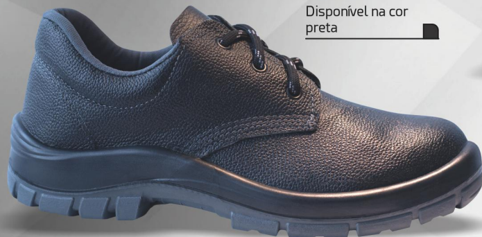
45203 Disponível na cor preta