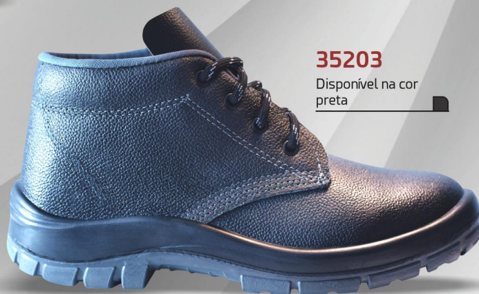
35203 Disponível na cor preta