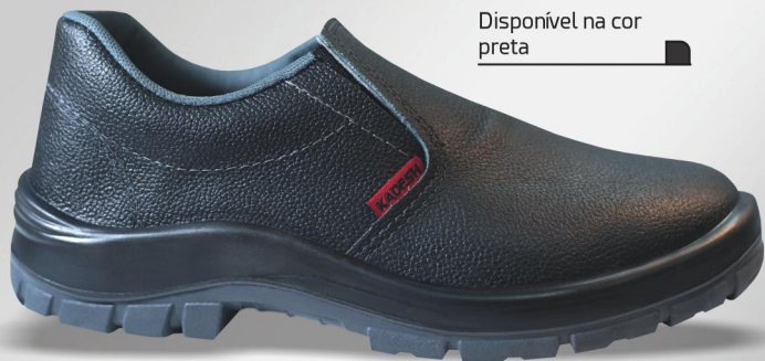
45201 Disponível na cor preta