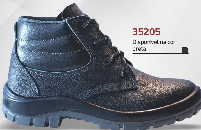
35205 Disponível na cor preta