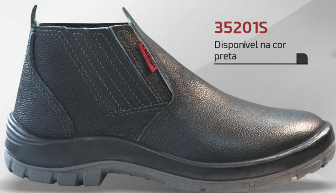
35201S Disponível na cor preta