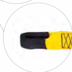
Cinturão Paraquedista com Abdominal 5 Fivelas e A2