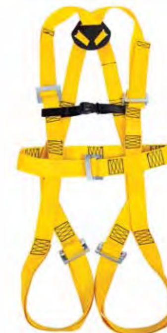
Cinturão Paraquedista com Regulagem