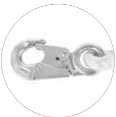
Talabarte de Posicionamento