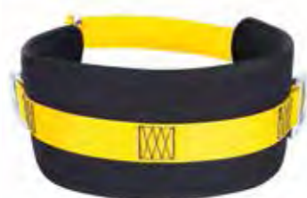
Cinturão Eletricista Abdominal