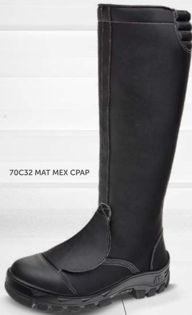
70C32 MAT MEX CPAP