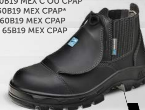
50B19 MEX C OU CPAP 70B19 MEX C OU CPAP 30B19 MEX CPAP* 60B19 MEX CPAP 65B19 MEX CPAP