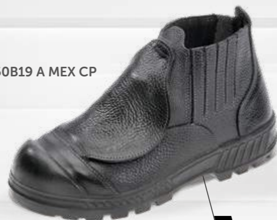
50B19 A MEX CP