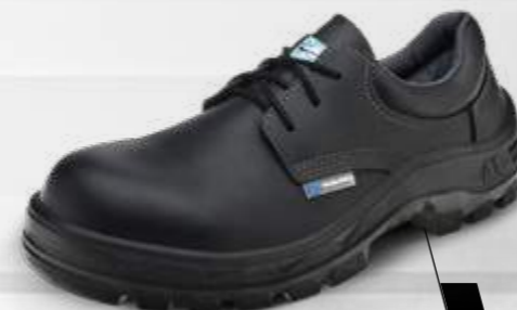
50S29 C OU CPAP 70S29 C OU CPAP 30S29 CPAP*