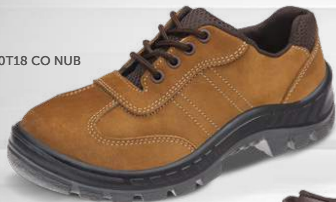
50T18 CO NUB