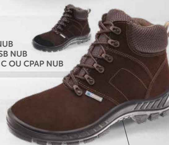
50B26 NUB 50B26 SB NUB 50B26 C OU CPAP NUB