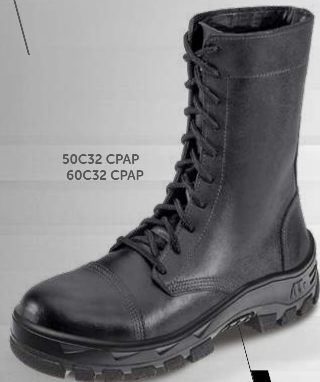
50C32 CPAP 60C32 CPAP