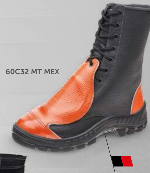
60C32 MT MEX