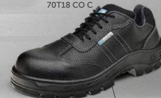
50T18 CO C 70T18 CO C