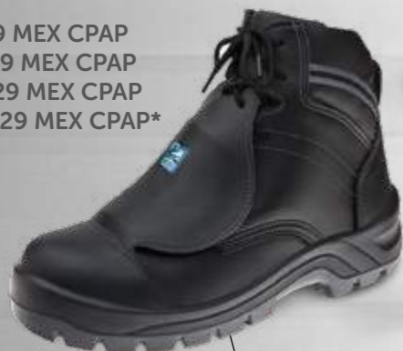
50B29 MEX CPAP 60B29 MEX CPAP 70B29 MEX CPAP 30B29 MEX CPAP*