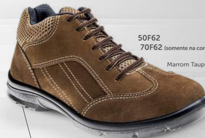
50F62 70F62 (somente na cor preta)

Cabedal em couro e microfibrã, mais leve e respirável, forro interno com reforço acolchoado, solado em PU Bidensidade antiderrapante que garante estabilidade e amortecimento. Muito mais conforto para aumentar seu desempenho no dia a dia.