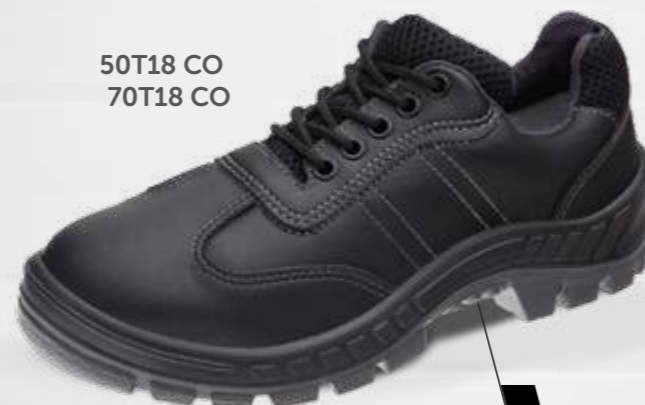
50T18 CO 70T18 CO