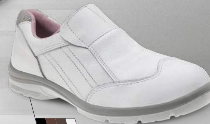
50F61 70F61 (somente na cor preta)