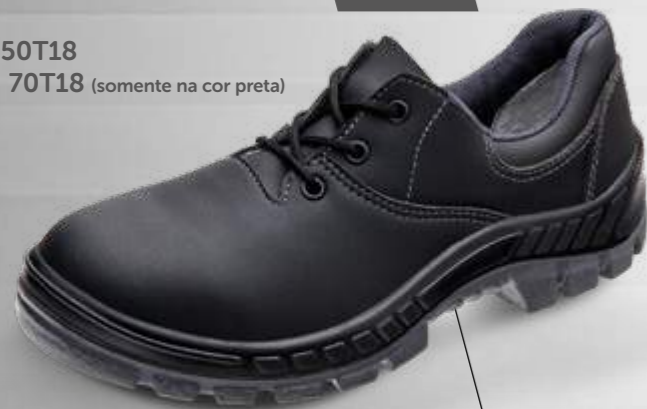
50T18 70T18 (somente na cor preta)