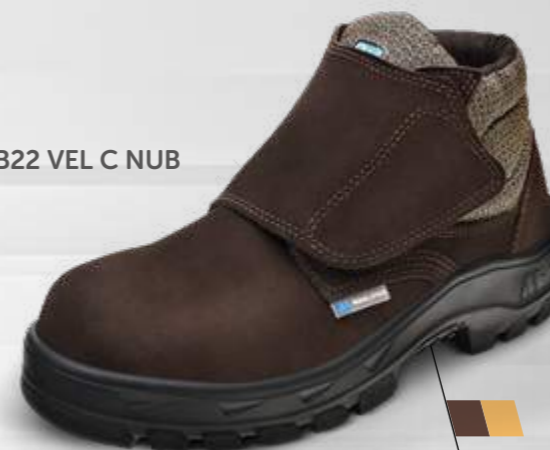
50B22 VEL C NUB