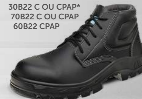
50B22 C OU CPAP 30B22 C OU CPAP* 70B22 C OU CPAP 60B22 CPAP