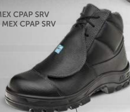
50B29 MEX CPAP SRV 60B29 MEX CPAP SRV