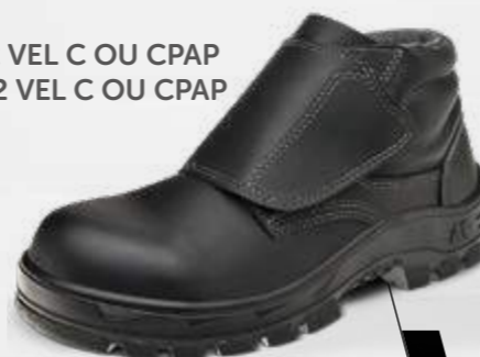
50B22 VEL C OU CPAP 70B22 VEL C OU CPAP