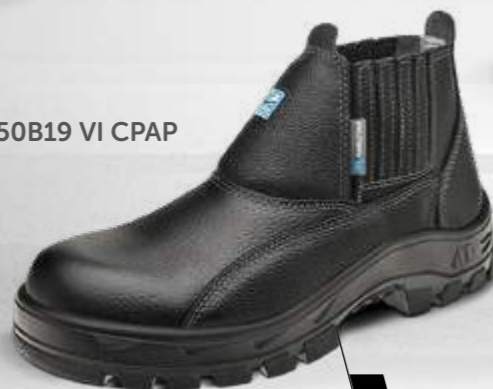
50B19 VI CPAP