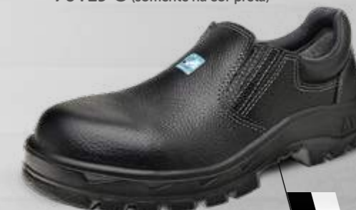
50T19 C OU CPAP 70T19 C (somente na cor preta)