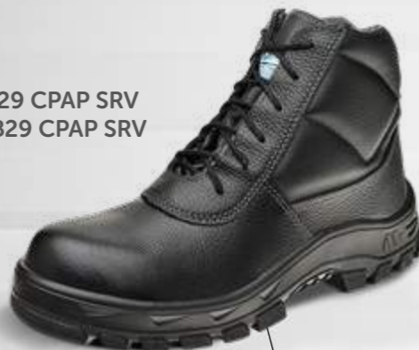
50B29 CPAP SRV 60B29 CPAP SRV