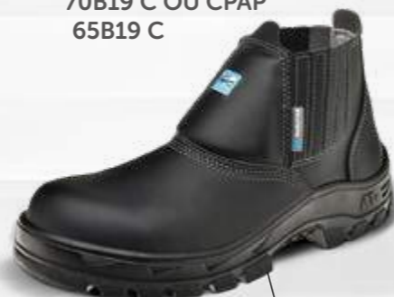
50B19 C OU CPAP 60B19 C OU CPAP 30B19 C OU CPAP* 70B19 C OU CPAP 65B19 C