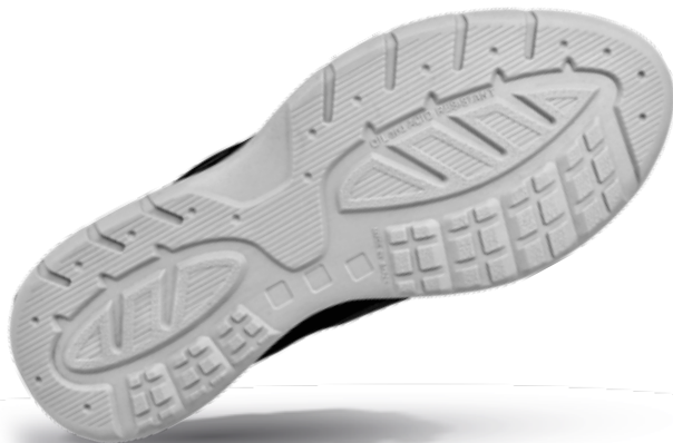
SOLADO: ULTRALEV MASCULINO