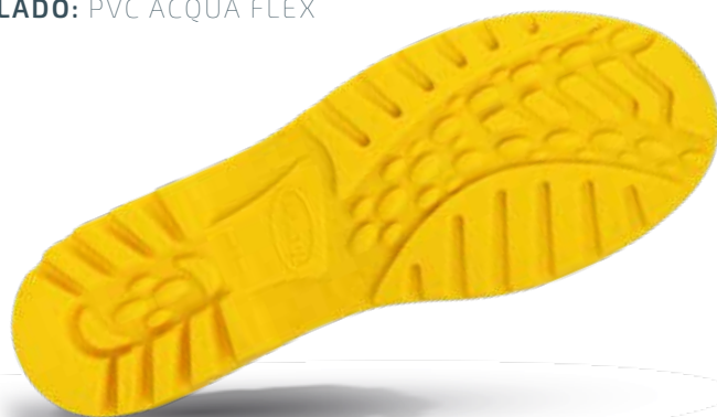
SOLADO: PVC ACQUA FLEX