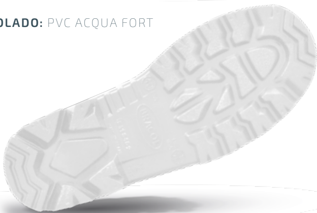
SOLADO: PVC ACQUA FORT